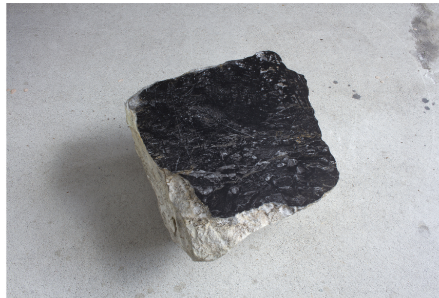
「石化する風景#2_舞鶴 寺田」/330×300×170mm/2021年/京都府舞鶴市寺田 石灰岩